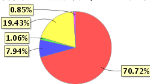
投资组合资产配置图表(2020年9月30日)