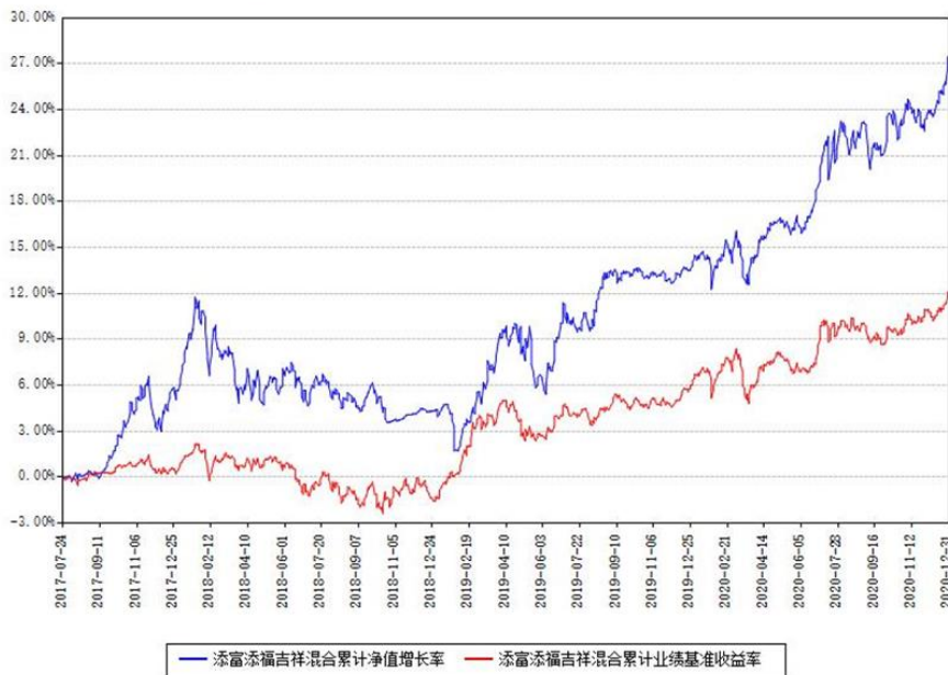
添富添福吉祥混合累计净值增长率与同期业绩基准收益率对比图

(二) 自基金合同生效以来基金累计净值增长率变动及其与同期业绩比较基准收益率变动的比较图