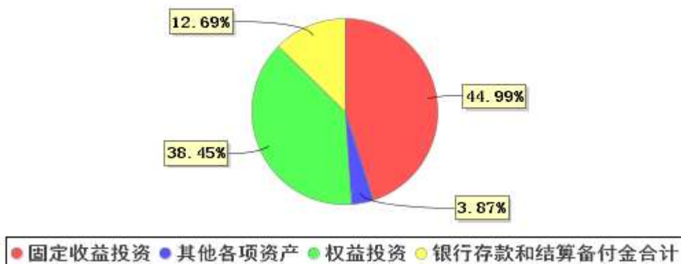
投资组合资产配置图表(2021年6月30日)