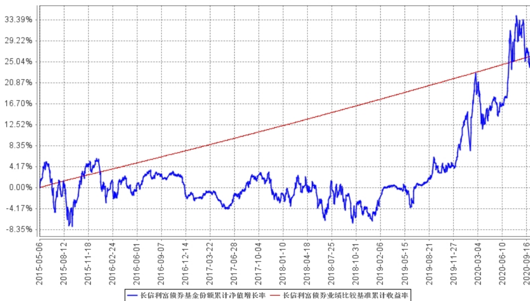
长信利富债券基金份额累计净值增长率与同期业绩比较基准收益率的历史走势对比图