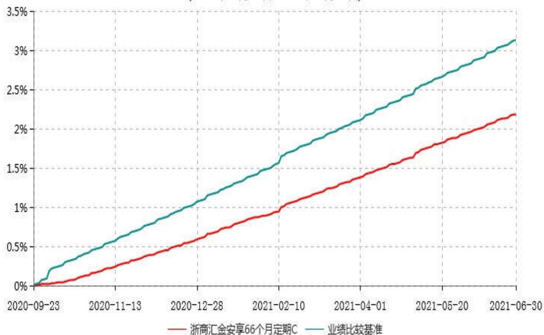
浙商汇金安享66个月定期C累计净值增长率与业绩比较基准收益率历史走势对比图 (2020年09月23日-2021年06月30日)

注：本基金合同生效日为 2020 年 9 月 23 日，自基金合同生效日起至本报告期末不满一年。至本报告期末，本基金已完成建仓，建仓期为 2020 年 9 月 23 日-2021 年 3 月 22 日，但报告期末距建仓结束不满一年，建仓期结束时各项资产配置比例符合合同约定。