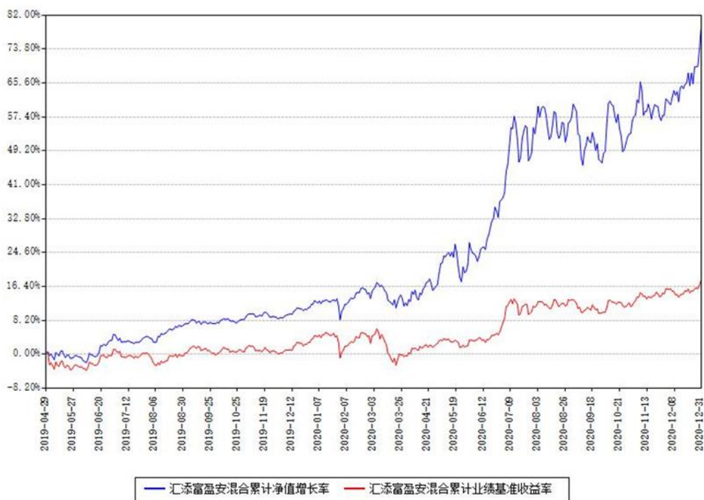
汇添富盈安混合累计净值增长率与同期业绩基准收益率对比图

(二) 自基金合同生效以来基金累计净值增长率变动及其与同期业绩比较基准收益率变动的比较图