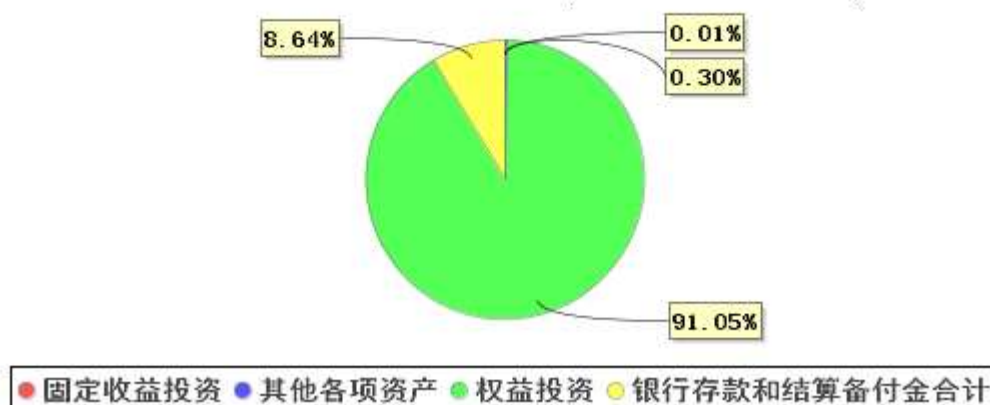
投资组合资产配置图表 (2021年6月30日)