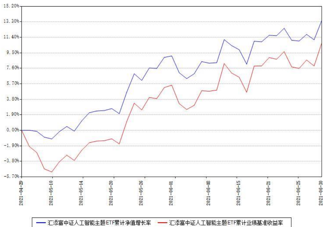
汇添富中证人工智能主题ETF累计净值增长率与同期业绩基准收益率对比图