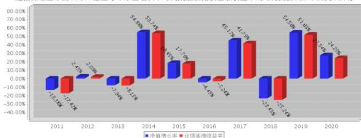
建信深证基本面60ETF基金每年净值增长率与同期业绩比较基准收益率的对比图(2020年12月31日)