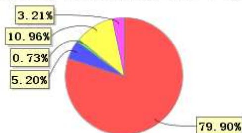
投资组合资产配置图表(2021年6月30日)