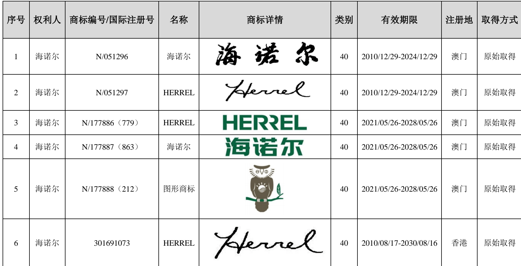
附表四：发行人及其下属企业的境外商标清单