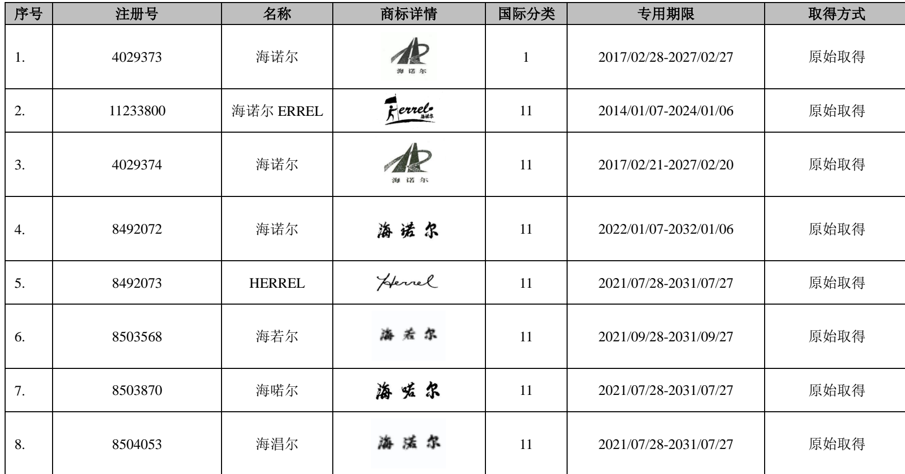
附表二：发行人及其下属企业的境内商标清单