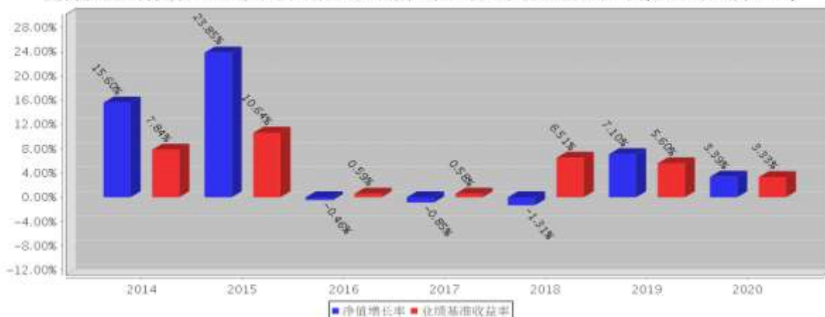
建信双息红利债券C基金每年净值增长率与同期业绩比较基准收益率的对比图(2020年12月31日)