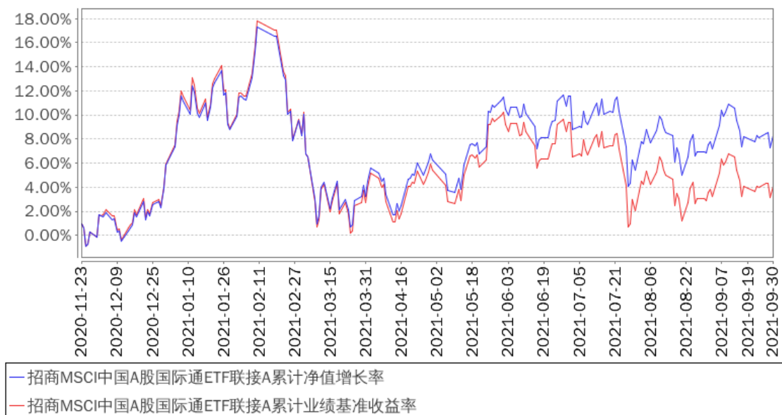
招商MSCI中国A股国际通ETF联接A累计净值增长率与同期业绩比较基准收益率的历史走势对比图