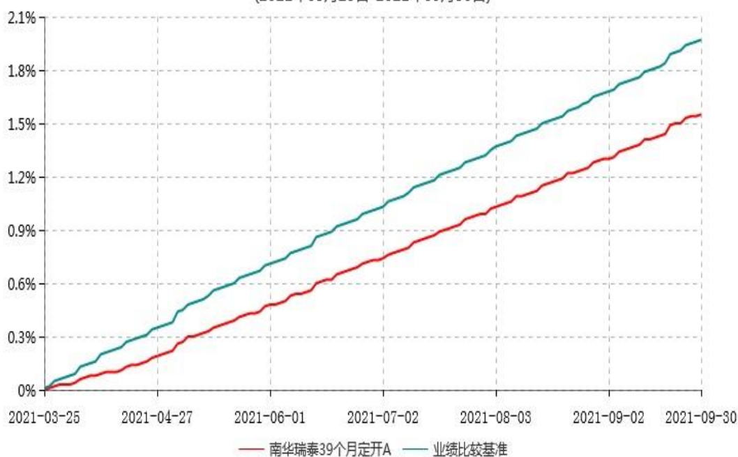
南华瑞泰39个月定开A累计净值增长率与业绩比较基准收益率历史走势对比图 (2021年03月25日-2021年09月30日)