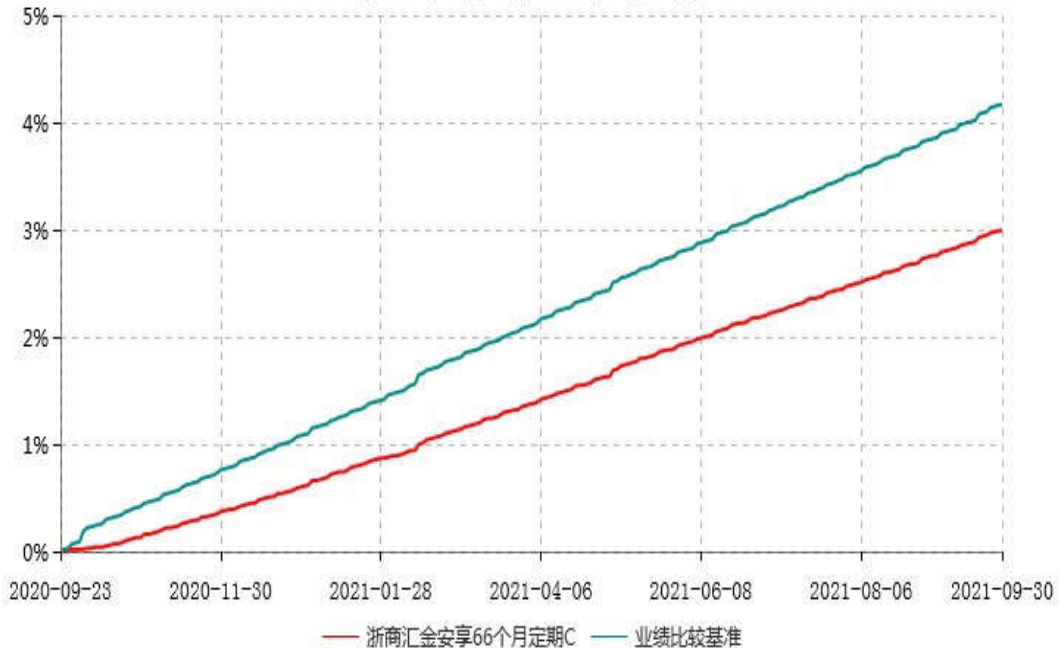
浙商汇金安享66个月定期C累计净值增长率与业绩比较基准收益率历史走势对比图 (2020年09月23日-2021年09月30日)

注：本基金合同生效日为 2020 年 9 月 23 日，至本报告期末，本基金已完成建仓，建仓期为 2020 年 9 月 23 日-2021 年 3 月 22 日，但报告期末距建仓结束不满一年，建仓期结束时各项资产配置比例符合合同约定。