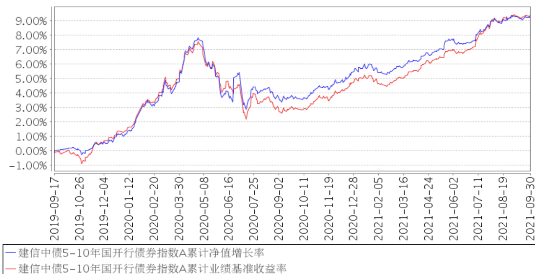
建信中债5-10年国开行债券指数A累计净值增长率与同期业绩比较基准收益率的历史走势对比图