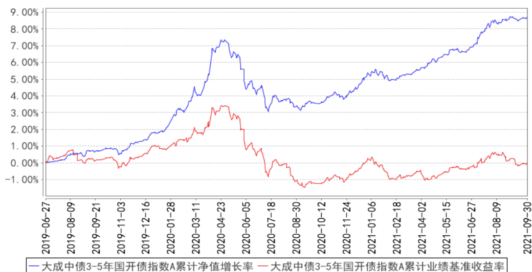
大成中债 3-5 年国开债指数 A 累计净值增长率与同期业绩比较基准收益率的历史走势对比图