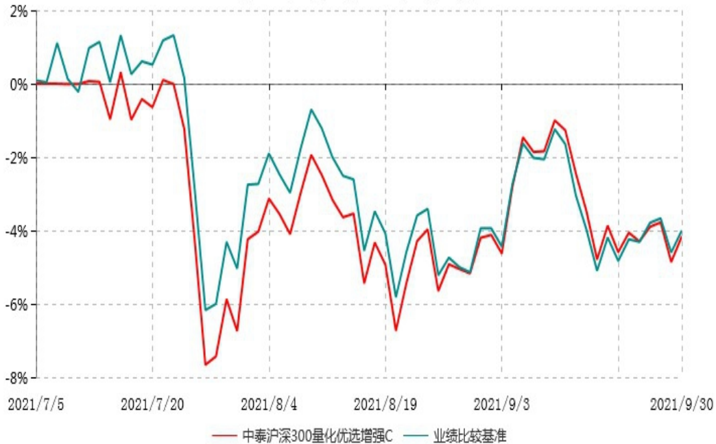
中泰沪深300量化优选增强C累计净值增长率与业绩比较基准收益率历史走势对比图 (2021年07月05日-2021年09月30日)