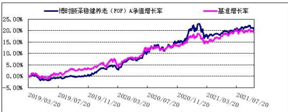
2. 博时颐泽稳健养老（FOF）C: