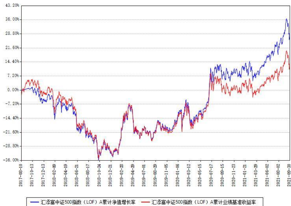
汇添富中证500指数 (LOF) A累计净值增长率与同期业绩基准收益率对比图