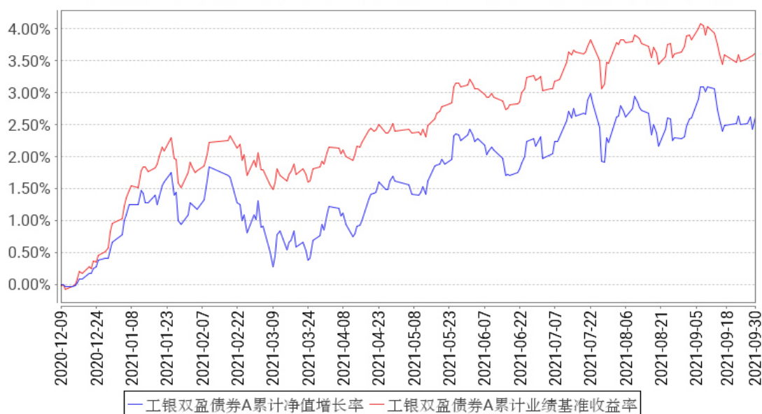
工银双盈债券A累计净值增长率与同期业绩比较基准收益率的历史走势对比图