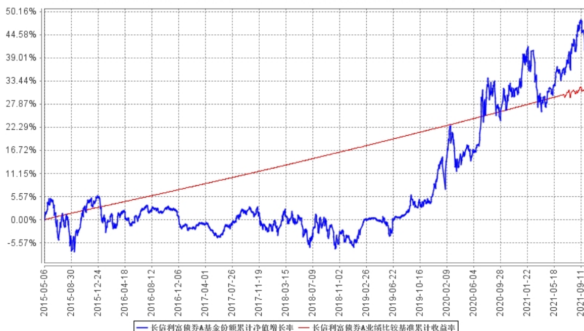
长信利富债券A基金份额累计净值增长率与同期业绩比较基准收益率的历史走势对比图