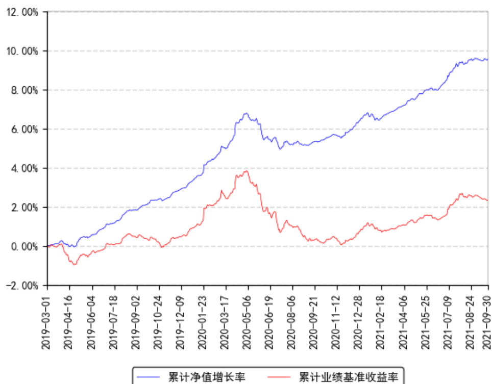
南方亨元债券发起A累计净值增长率与同期业绩比较基准收益率的历史走势对比图