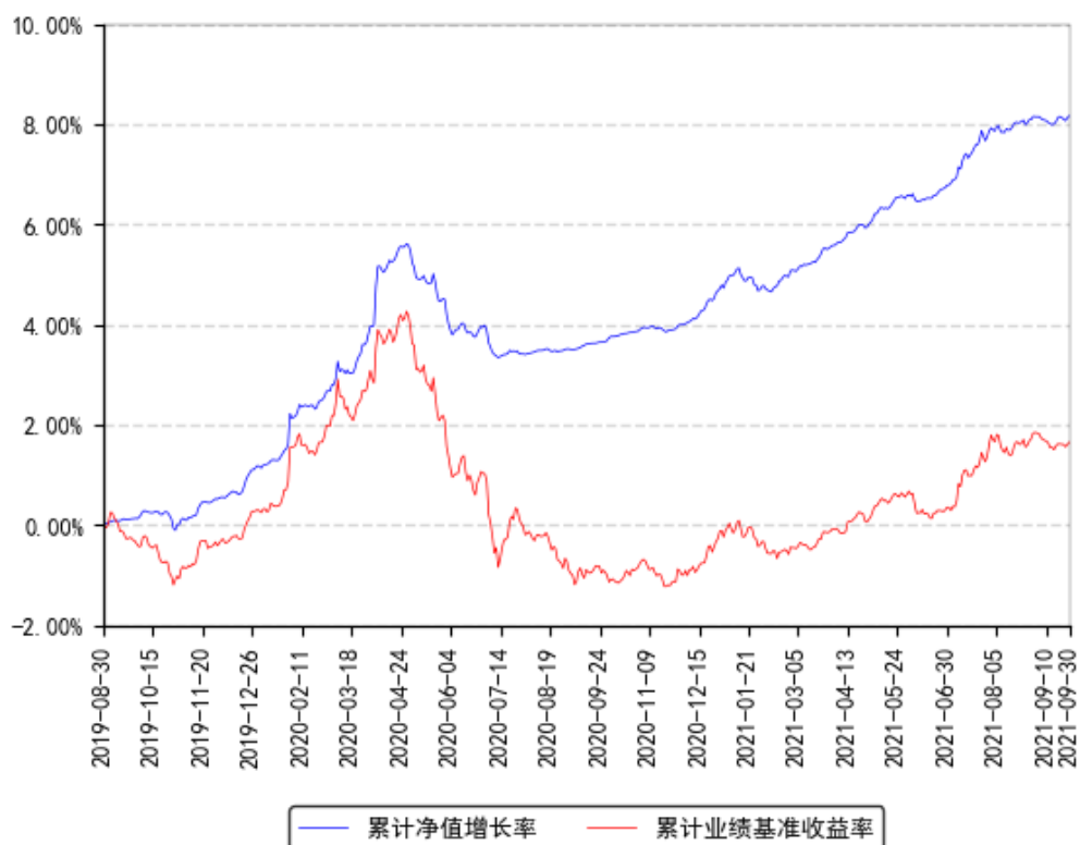
南方贺元利率债A累计净值增长率与同期业绩比较基准收益率的历史走势对比图