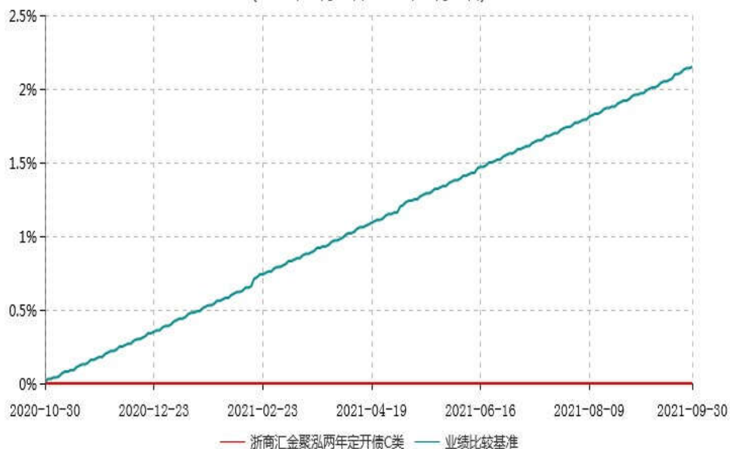
浙商汇金聚泓两年定开债C类累计净值增长率与业绩比较基准收益率历史走势对比图 (2020年10月30日-2021年9月30日)

注：本基金合同生效日为2020年10月30日，自基金合同生效日起至本报告期末不满一年。至本报告期末，本基金已完成建仓，但报告期末距建仓结束不满一年，建仓期为2020年10月30日-2021年4月29日，本基金建仓期结束时各项资产配置比例符合合同的约定。