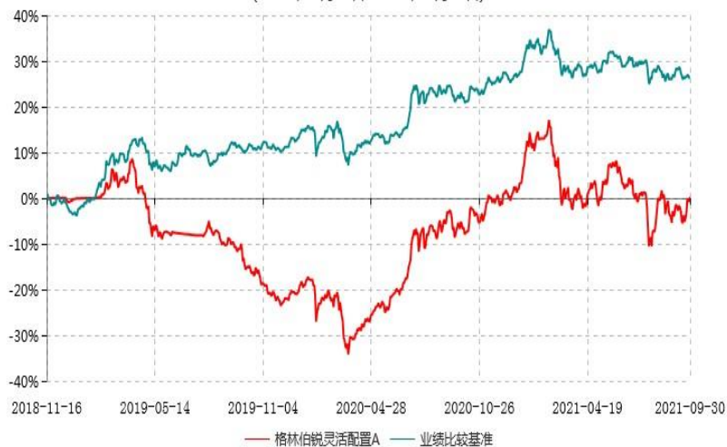
格林伯锐灵活配置A累计净值增长率与业绩比较基准收益率历史走势对比图 (2018年11月16日-2021年09月30日)