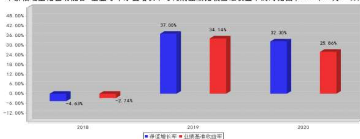
华泰柏瑞量化驱动混合C基金每年净值增长率与同期业绩比较基准收益率的对比图(2020年12月31日)

注:业绩表现截止日期 2020 年 12 月 31 日。基金过往业绩不代表未来表现。