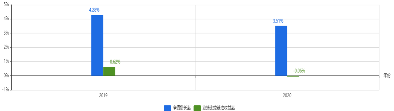
基金每年的净值增长率及与同期业绩比较基准的比较图