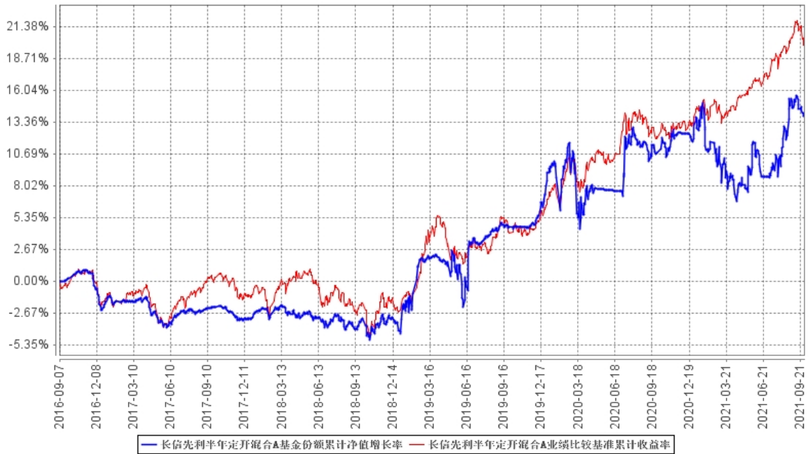
长信先利半年定开混合A基金份额累计净值增长率与同期业绩比较基准收益率的历史走势对比图