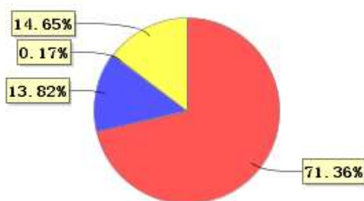
投资组合资产配置图表(2021年9月30日)

● 固定收益投资 ● 买入返售金融资产 ● 其他各项资产 ● 银行存款和结算备付金合计