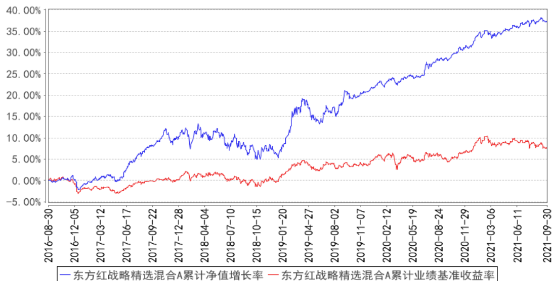
东方红战略精选混合A累计净值增长率与同期业绩比较基准收益率的历史走势对比图

2、自基金合同生效以来基金累计净值增长率变动及其与同期业绩比较基准收益率变动的比较