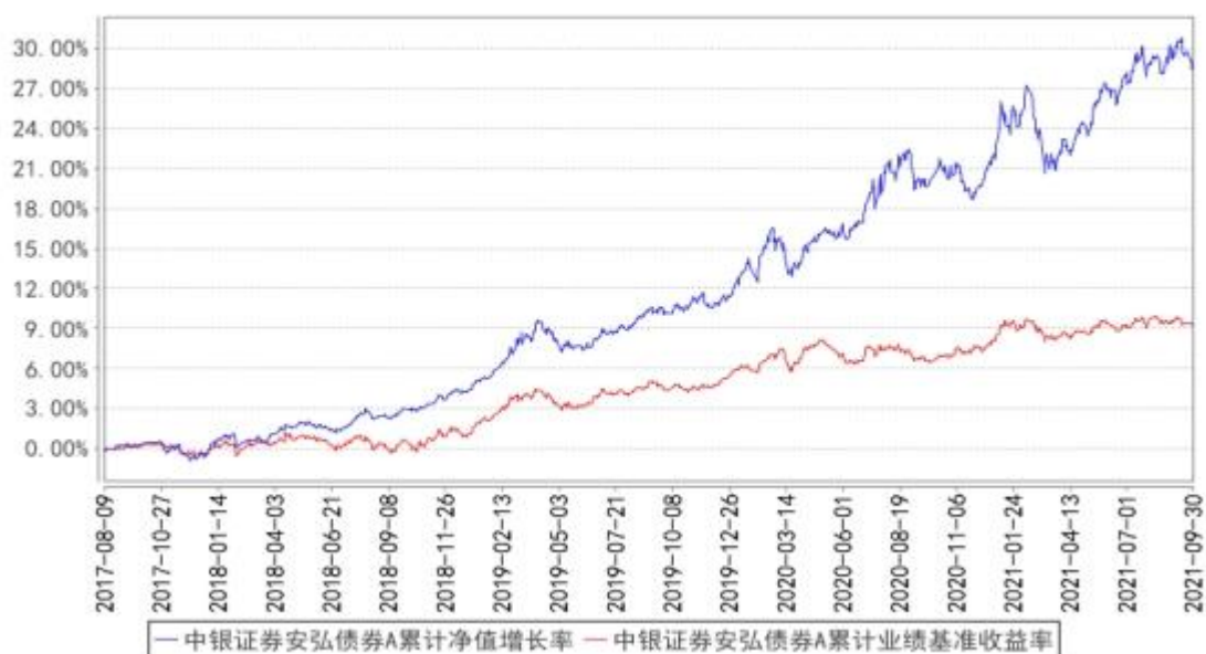
中银证券安弘债券A累计净值增长率与同期业绩比较基准收益率的历史走势对比图

二、自基金合同生效以来基金累计净值增长率变动及其与同期业绩比较基准收益率变动的比较