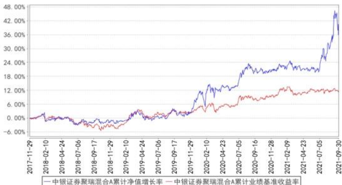
中银证券聚瑞混合A累计净值增长率与同期业绩比较基准收益率的历史走势对比图

2、自基金合同生效以来基金累计净值增长率变动及其与同期业绩比较基准收益率变动的比较