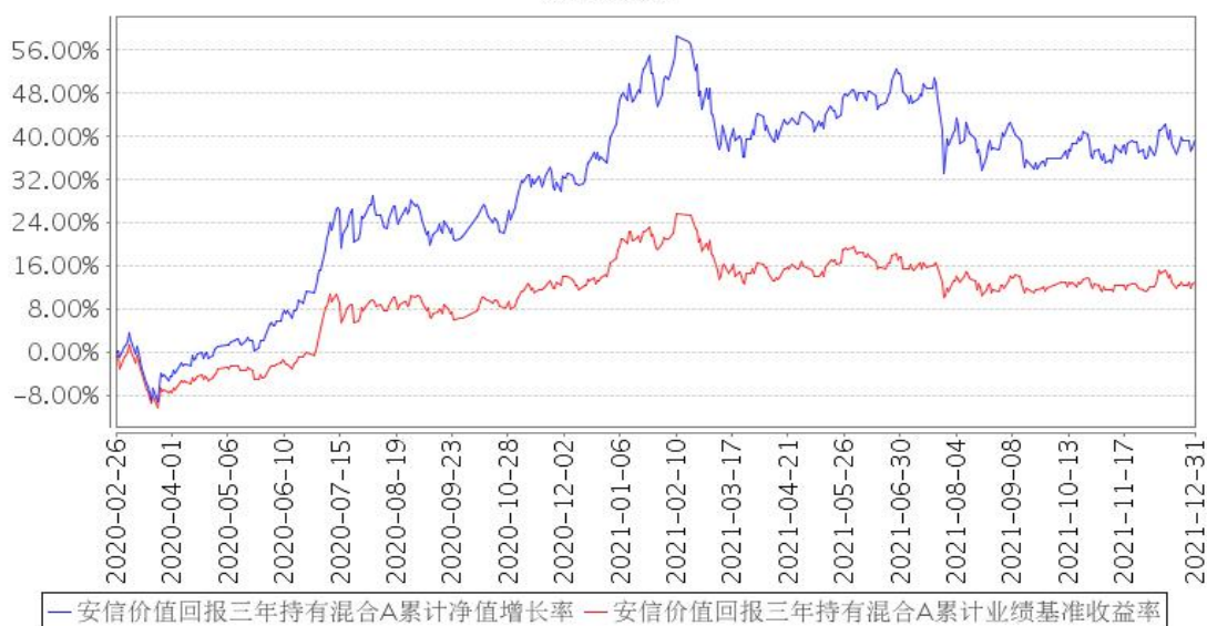
安信价值回报三年持有混合A累计净值增长率与同期业绩比较基准收益率的历史走势对比图