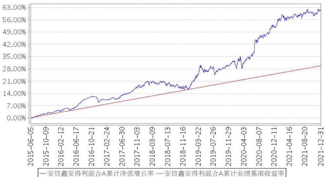
安信鑫安得利混合A累计净值增长率与同期业绩比较基准收益率的历史走势对比图