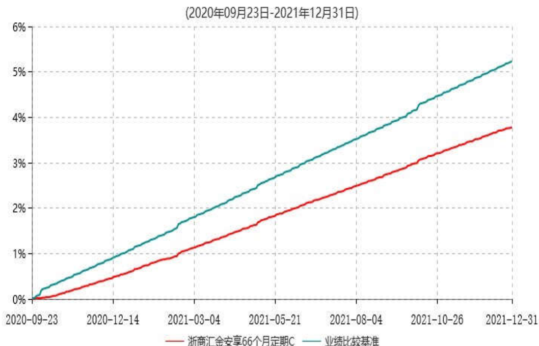
浙商汇金安享66个月定期C累计净值增长率与业绩比较基准收益率历史走势对比图

注：本基金合同生效日为 2020 年 9 月 23 日，至本报告期末，本基金已完成建仓，建仓期为 2020 年 9 月 23 日-2021 年 3 月 22 日，但报告期末距建仓结束不满一年，建仓期结束时各项资产配置比例符合合同约定。