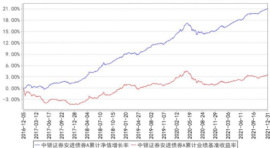
中银证券安进债券A累计净值增长率与同期业绩比较基准收益率的历史走势对比图