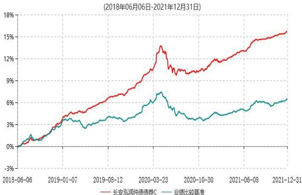
长安泓润纯债债券C累计净值增长率与业绩比较基准收益率历史走势对比图

根据基金合同的规定，自基金合同生效日起 6 个月内基金各项资产配置比例需符合基金合同要求。本基金在建仓期结束后，各项资产配置比例已符合基金合同有关投资比例的约定。基金合同生效日至报告期末，本基金运作时间已满一年。图示日期为 2018 年 6 月 6 日至 2021 年 12 月 31 日。