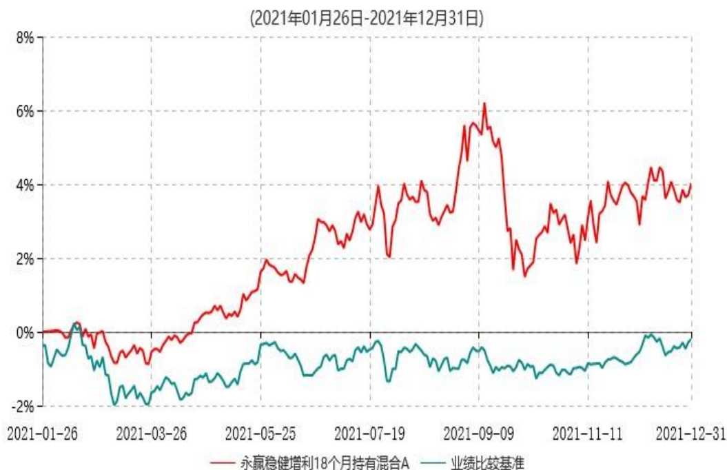
永赢稳健增利18个月持有混合A累计净值增长率与业绩比较基准收益率历史走势对比图