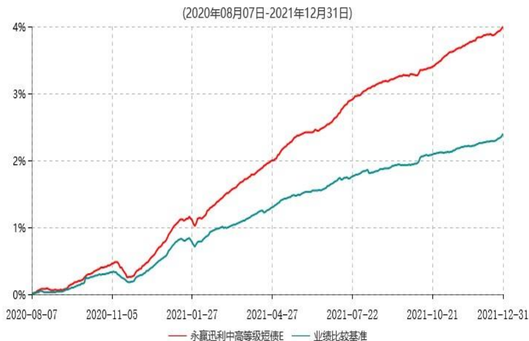
永赢迅利中高等级短债E累计净值增长率与业绩比较基准收益率历史走势对比图