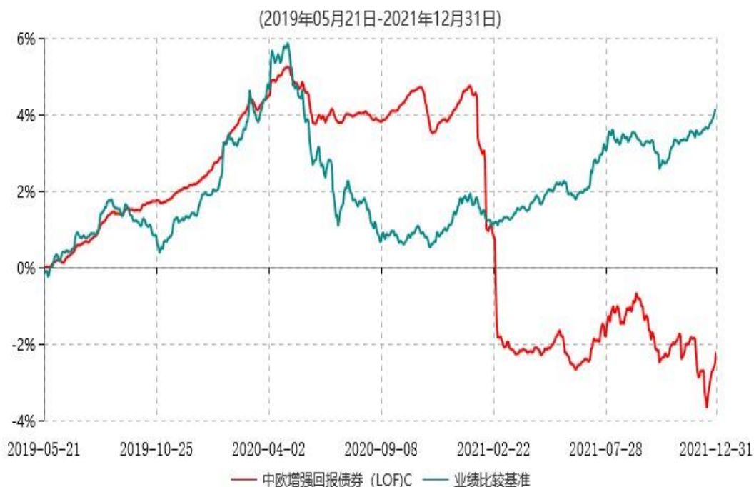
中欧增强回报债券 (LOF)C 累计净值增长率与业绩比较基准收益率历史走势对比图

注：本基金于 2019 年 5 月 20 日新增 C 份额，图示日期为 2019 年 5 月 21 日至 2021 年 12 月 31 日。