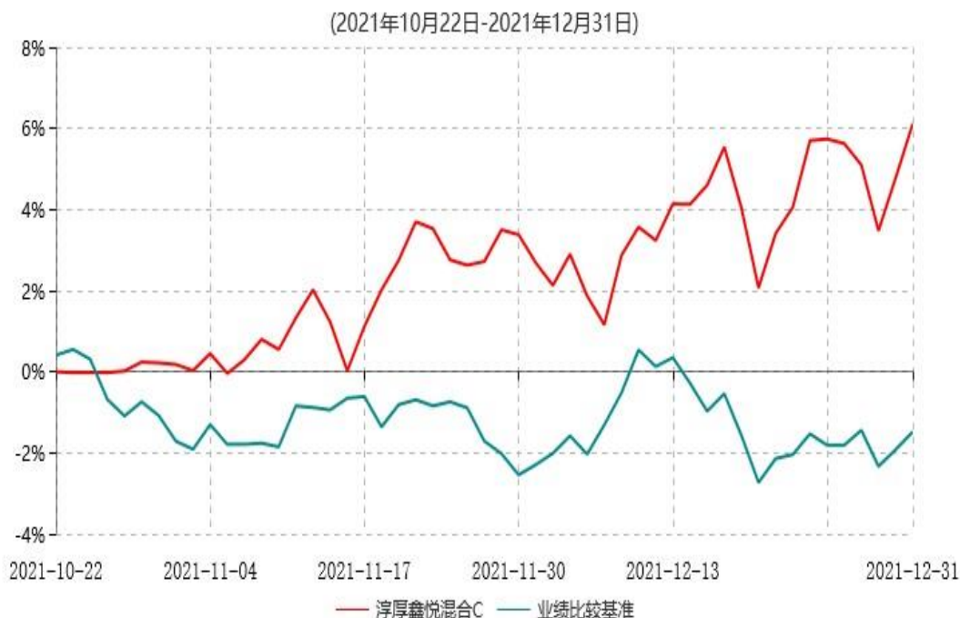
淳厚鑫悦混合C累计净值增长率与业绩比较基准收益率历史走势对比图

注：本基金基金合同生效日为 2021 年 10 月 22 日，至报告期末未满 1 年。按基金合同规定，本基金自基金合同生效起 6 个月内为建仓期。截止本报告期末，本基金仍处于建仓期内。