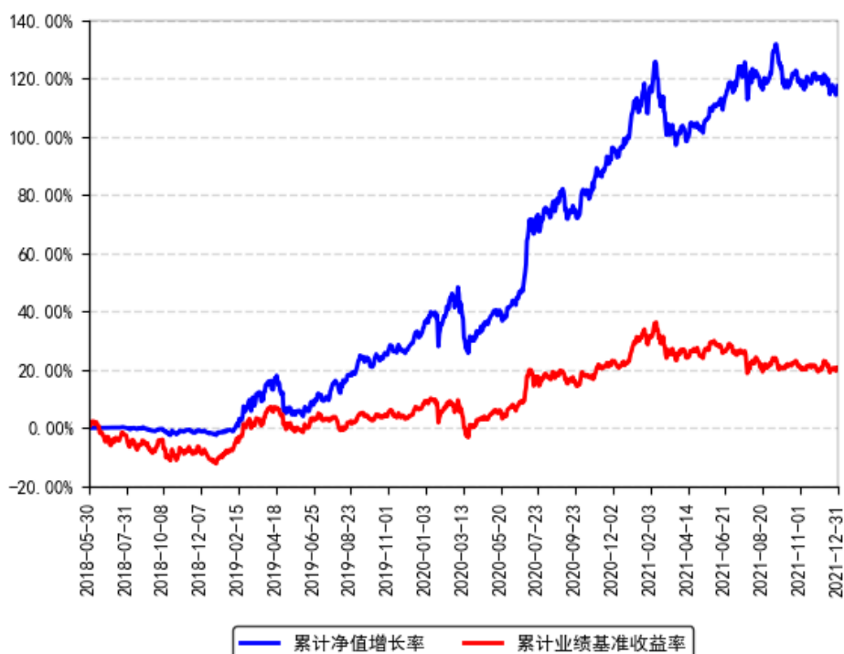
南方君信灵活配置混合A累计净值增长率与同期业绩比较基准收益率的历史走势对比图