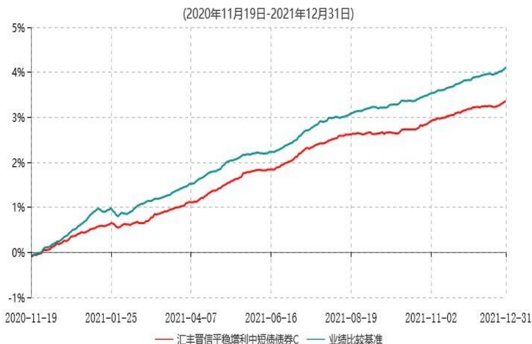
汇丰晋信平稳增利中短债债券C累计净值增长率与业绩比较基准收益率历史走势对比图

注：1、按照基金合同的约定，基金的投资组合比例为：本基金投资于债券的比例不低于基金资产的 80%，其中投资于剩余期限不超过三年（含三年）的债券资产的比例不低于非现金资产的 80%；持有现金或到期日在 1 年以内的政府债券不低于基金资产净值的 5%，其中现金不包括结算备付金、存出保证金和应收申购款等。本基金投资的信用债券的债项评级或主体评级须在 AA+（含 AA+）以上，本基金投资于 AA+ 级别信用债的比例不高于基金资产的 70%；投资于 AAA 级别信用债的比例不高于基金资产的 95%。