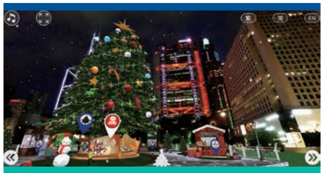
於香港之聖誕小鎮虛擬之旅

於新加坡，我們交付DBS Transformation Week 2020。我們為惠普公司於亞洲、英國及美國交付一連串虛擬活動。我們亦於美國激活各式各樣的虛擬活動，包括電子遊戲大會以至民權大會等。本集團亦激活於澳洲布里斯本之首屆陸軍參謀長座談會。