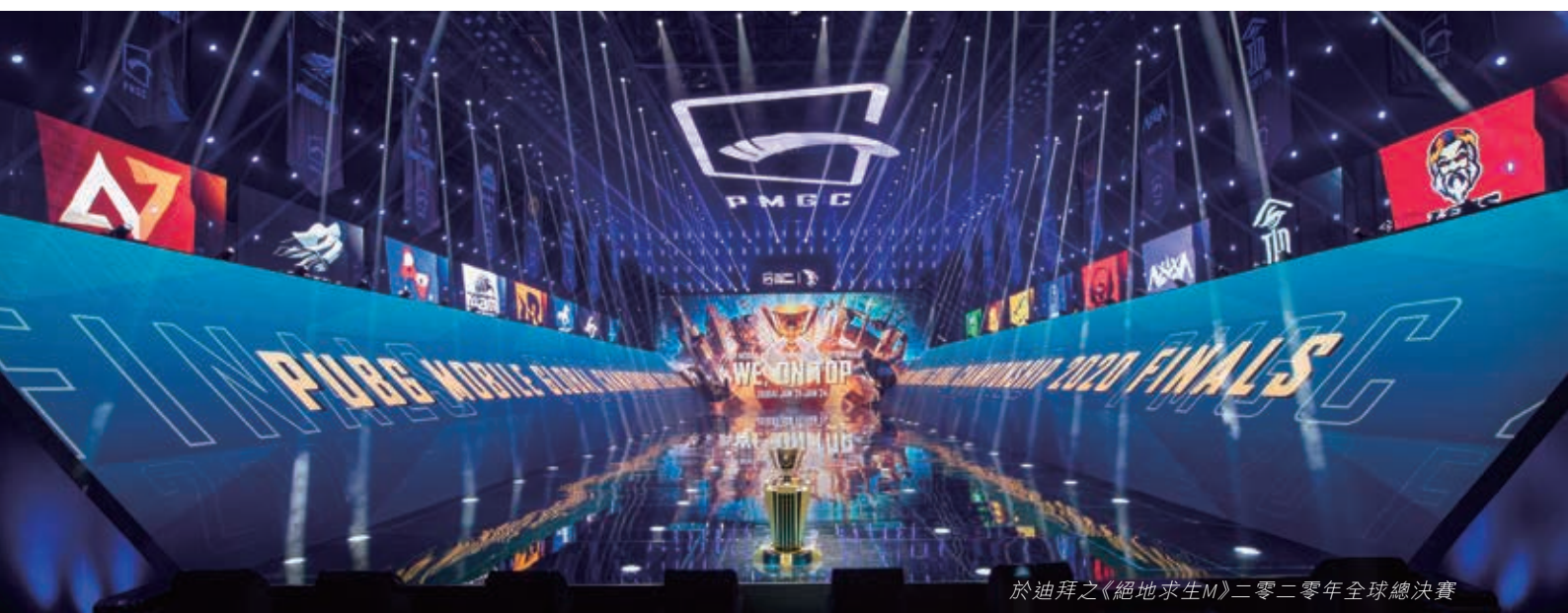
於迪拜之《絕地求生M》二零二零年全球總決賽