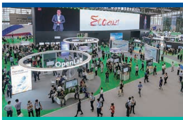
於深圳之華為中國生態大會

於本年度，本集團業務所在的許多國家繼續實施和修訂外遊限制及社交距離規定。儘管規模一般較小並輔以數碼激活，實體活動開始於已重啟的市場復辦。因此，筆克獲委任為大會指定服務供應商的展覽總數較去年增加23%，總展覽空間增加92%。儘管我們樂見改善，但表現仍然未達二零一九年疫情前的水平。