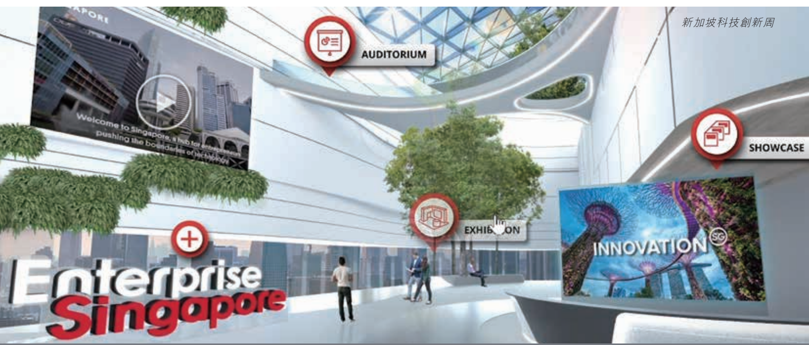
新加坡科技創新周