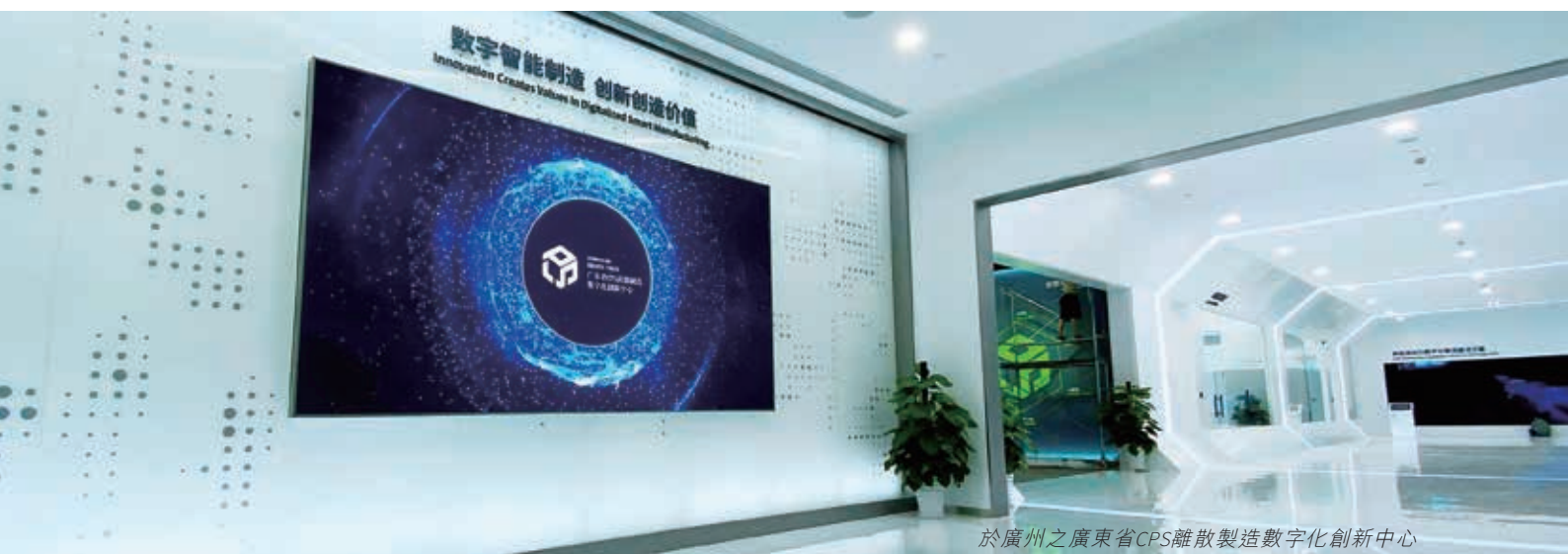
於廣州之廣東省CPS離散製造數字化創新中心