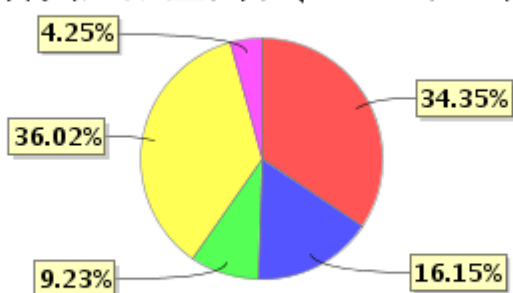
投资组合资产配置图表(2021年12月31日)