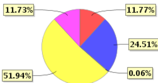
投资组合资产配置图表(2021年12月31日)