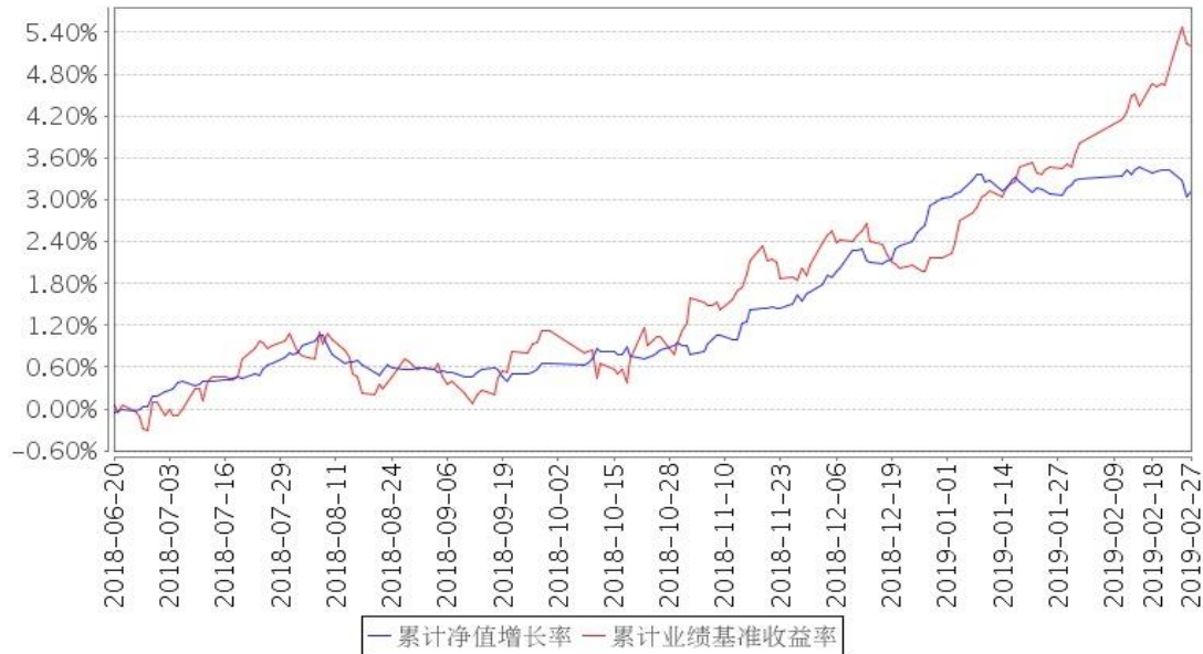
景顺长城景瑞双利债券累计净值增长率与同期业绩比较基准收益率的历史走势对比图

注:因景顺长城景瑞双利定期开放债券型证券投资基金(以下简称“景瑞双利定期开放债券基金”)触发基金合同约定的转型条款,该基金自2018年6月20日转型为景顺长城景瑞双利债券型证券投资基金(以下简称“景瑞双利债券基金”)。