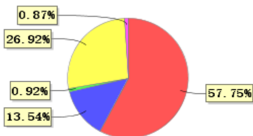
投资组合资产配置图表(2021年3月31日)

● 固定收益投资 ● 买入返售金融资产 ● 其他各项资产 ● 权益投资 ● 银行存款和结算备付金合计