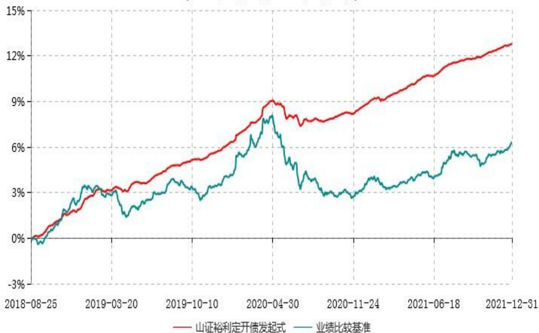
山西证券裕利定期开放债券型发起式证券投资基金累计净值增长率与业绩比较基准收益率历史走势对比图 (2018年08月25日-2021年12月31日)